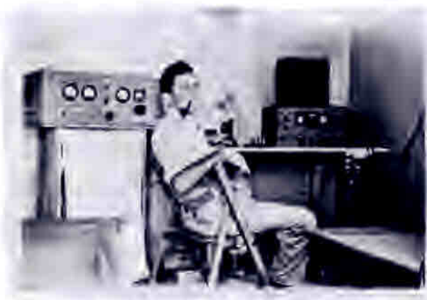
תמונה 4 - חדרו ב-"סרפנד" מראה כללי התחנה כולל "ההיגוטי"

בכל התקופה הארוכה והסוערת הזו, לא זכורה לי, אפילו פעם אחת, שראיתנו מתרחק או מאבד עשתונות. מעטים היו אלו שידעו אודותיו, שכן אופיו הצנוע, הותירו הרבה מתחת ל-"NOISE LEVEL" החברתי. כזה הכרתיו "משחר נעורינו" וכזה אזכרהו תמיד.