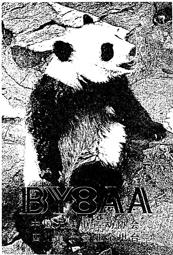
QSL - התחנה