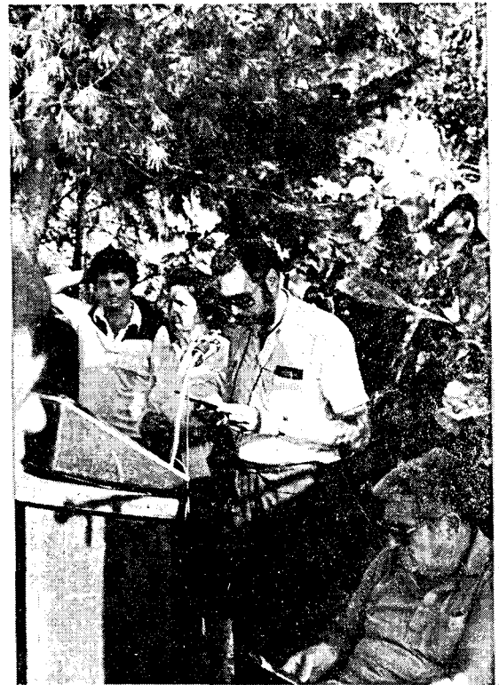
ישראל קז 4241K קורא את תפילת הנוטע

לאחר פתיחת הטקס הסייר "אוזי" את הלוט מעל לוח שייש המציין את החורשה. שמות הנפטרים הוקראו ע"י שמשון 4X4GF. אורחי הכבוד נשאו דברי ברכה קצרים. ישראל, 4241K, קרא את תפילת הנוטע (ראה תמונה). נציגי משפחות הנפטרים נטעו עצים בחורשה.