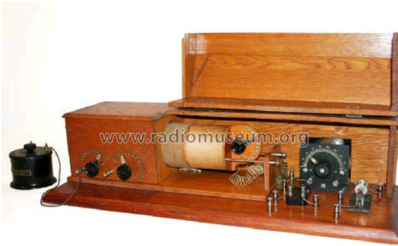
איור 3 - מקלט גביש (בניה עצמית) הכולל שנאי צימוד רופף משוכלל עם בוררי סנפים בראשוני ובמשני

הערה אישית בקשר למשדרי הניצוצות של תחילת המאה העשרים: