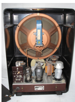
מקלט דגם VE301W